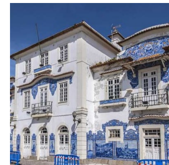
Historischer Bahnhof Aveiro