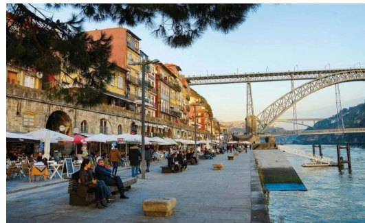
Cais da Ribeira